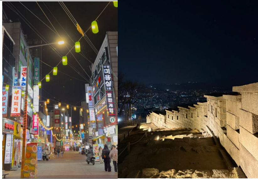
(左：大学路 右：駱山公園)