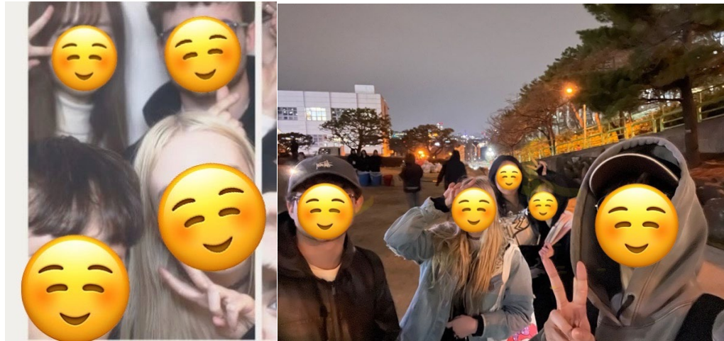
(左：初回に撮った人生 4 カット 右：大学の野外映画祭に参加した際)

また、バディは水原キャンパスに通っているので頻繁には会えませんが、友達も紹介してくれて、寂しくないように気遣ってくれました。しかし、チームではみんな英語で会話しているので英語ができないと辛いです。。