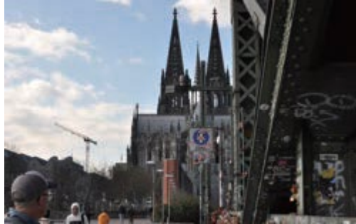
ホーエンツォレルン橋から見る大聖堂

た。バタバタすることも多かったが、このような突発的な旅行は初めてだったので楽しい思い出になった。Flixbus を使うとヨーロッパ内を格安で移動できるので、また他の国にも訪れてみたい。