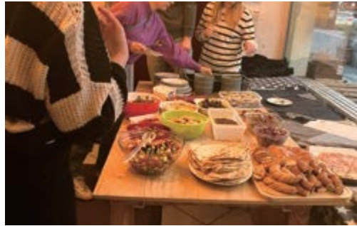
ビュッフェ形式でごはんを取っていく