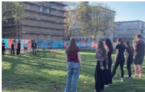
フランキーボールを観戦