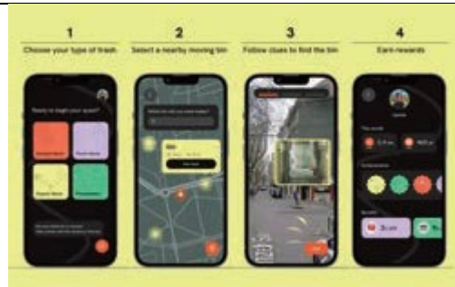
提案したサービスのアプリケーション