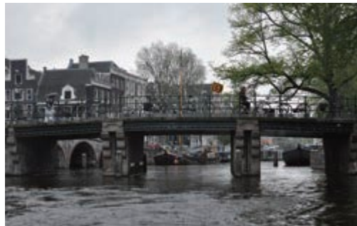
アムステルダム運河、あいにくのお天気