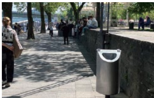
大聖堂周辺のゴミ箱の調査