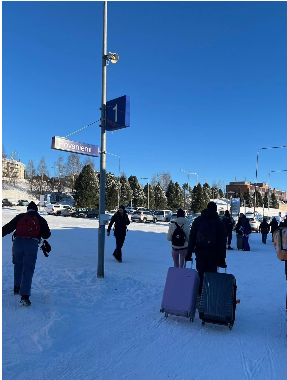
フィンランドの観光地 ロバニエミです。 これも2月ですが、雪がふかふかで歩くのが楽しかったです。