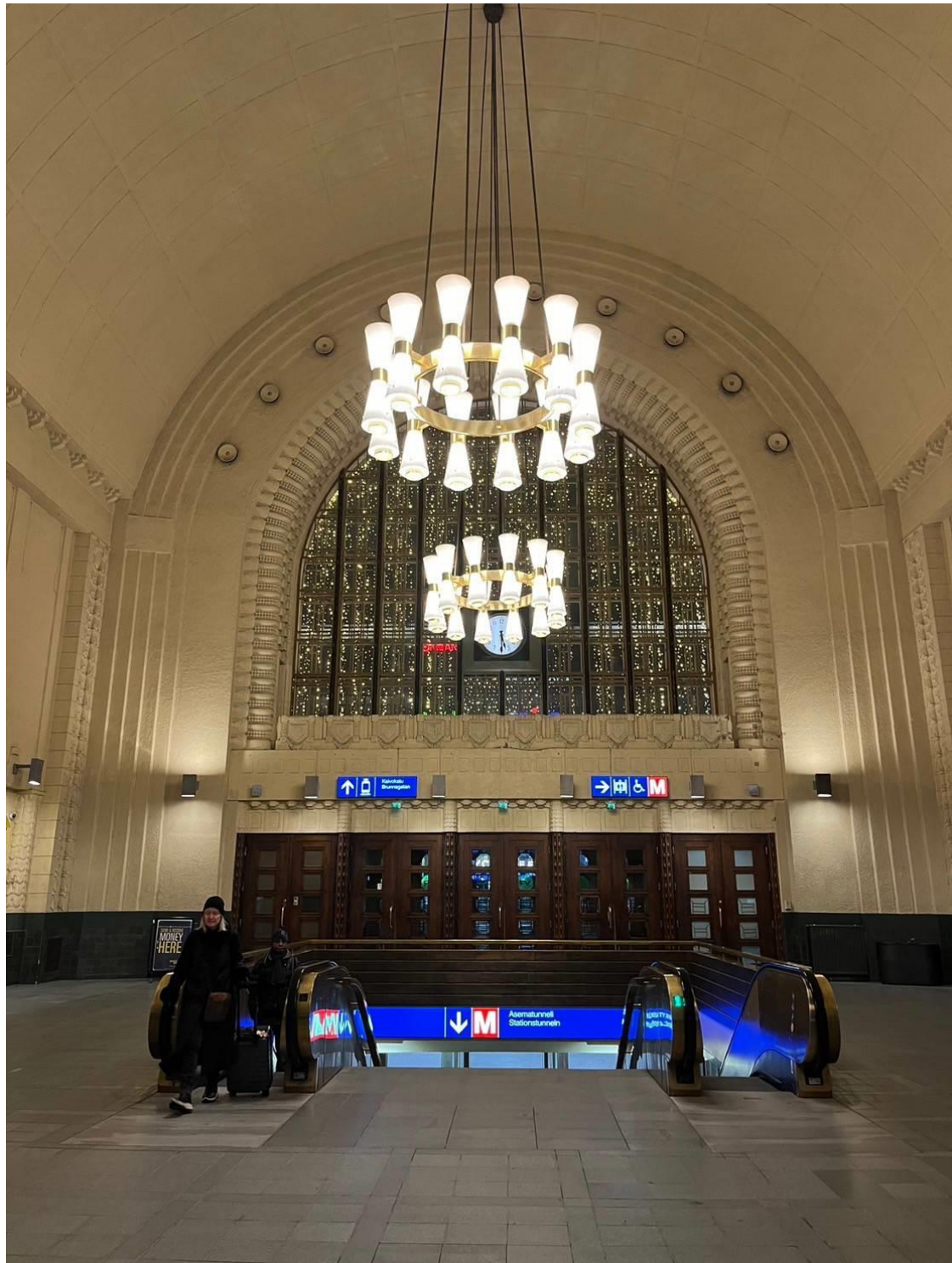
これもタンペレ駅です。構内ですね。