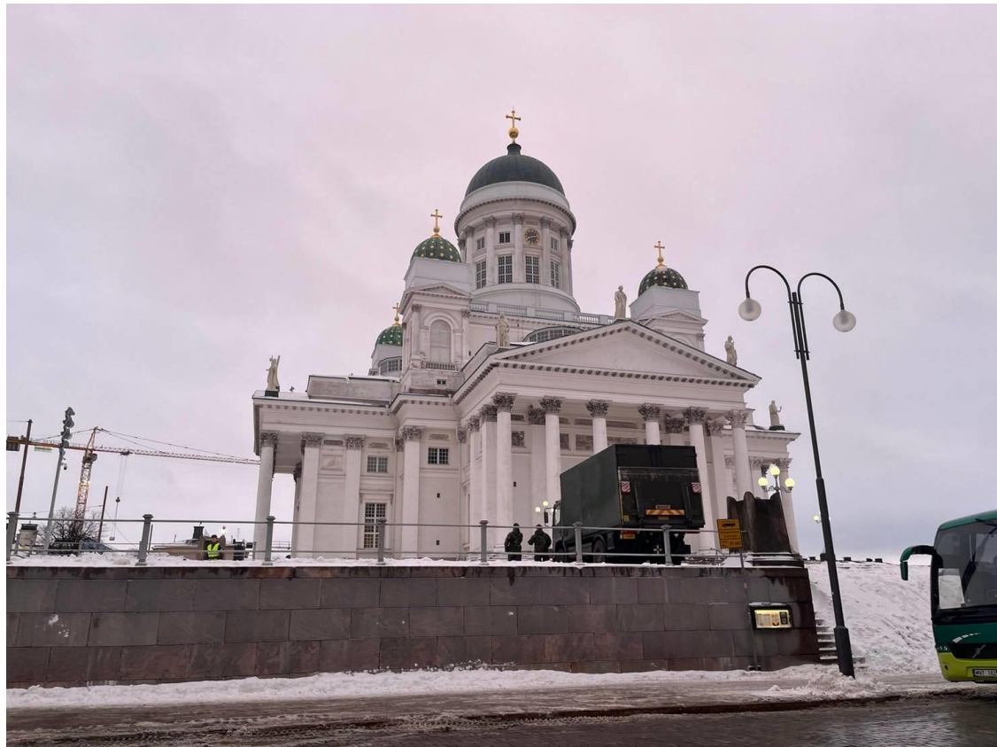
タンペレにある大聖堂です。