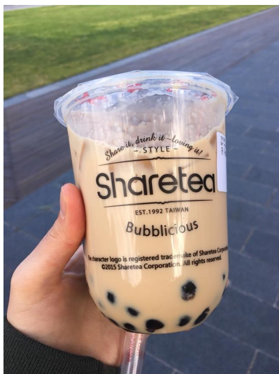
最近学内にできたお店のタピオカドリンク 開店してすぐの午前中はあまり並んでいません