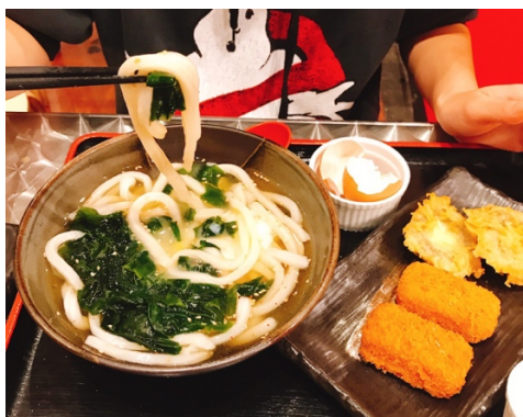
勉強の合間に市街で食べたうどん ちゃんと日本の出汁の味で美味しかった 横にあるのはカニクリームコロッケと椎茸の天ぷら

レビューでは、本来であれば口頭で自分のアウトラインの内容を紹介し、口頭でアドバイスをもらう、という形式だったのですが、自分はアウトラインを紙に印刷して持って行き、英語が下手な自分が口頭で説明しては時間がかかりすぎてしまうのでこの紙を読んでアドバイスが欲しい、とグループの人に正直に伝えました。すると、グループのみんなは紙に目を通し、ゆっくりとした口調でアドバイスをくれました。そのあと先生がグループを見て回っているときに私のアウトラインにもアドバイスをくれたのですが、先生の行っている内容が分からず私がパニックになってしまった時も、グループのうちの一人が私にその内容を書き取っておいたメモを渡してくれて、なんとかそのアドバイスを自分のエッセイに生かすことができました。この時は助けてもらって嬉しい気持ちも勿論あったのですが、逆に自分がその子たちのために何もできなかったことが悔しくて、しばらく落ち込んでいました。ただこの経験が、私が初めてちゃんと周りに助けを求め、そして周りの人たちがそれに答えてくれたものだったので、自分の心を整理できる一つのきっかけになりました。一時期、何度か続けて授業内などで嫌なことが続いて精神的にきつい時もありましたが、助けてくれる人は必ずどこかにいるのだなと思い直しました。そして、その人たちに気がついてもらうためには、自分から声を上げることも時には必要なのだと痛感しました。次のセメスターでは、自分で解決できることは自分で対処しつつ、時には頼りっきりにならない程度に周りに助けを求めながら、そして自分も誰かの助けになりながら、学習を進めていければ、と考えています。