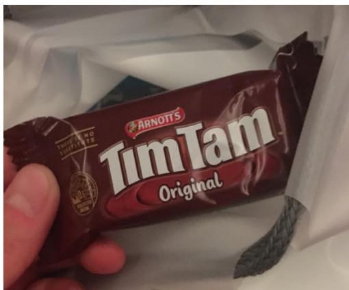
帰りの機内で出されたティムタム

ました。まだ帰ってすぐでバタバタしていますが、一度帰って来てしまうと留学中のことが一瞬のこのように感じます。少しずつゆっくりでも振り返りができればと思います。