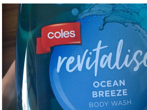
大手スーパーcolesのブランド商品 このcolesの赤いマークがある商品は大体安い

話は変わりますが、以前から寮の関係者に相談している夜の騒音問題について、完全な解決は無理そうなのが最近のストレスとしてあり、たまに困っています。アシスタントの人だけでなく寮の職員にメールを送り、もっと具体的な対策で騒音を防ぐことはできないのか、と訴えましたが、どこの誰が騒いでいるのが正確に分からない限り注意することができないので、もしうるさいことがあったらそちらから寮のセキュリティに電話してその場で注意してもらうように言ってくれ、それか自分で耳栓でもしてくれ、といったような答えしか返ってきませんでした。長時間騒いでいるわけではないので、別の建物にいるセキュリティを呼んだところで間に合わないのでは有効な解決策でもありません。騒ぎが続く時間が短いとしても、深夜に騒がれるたびに眠りを妨げられたりイライラしたりするので、やはり未然に防げるような対策を打ってほしいのが本音です。一度その職員の言う通り本当にセキュリティに通報しましたが、寮の定間に合いませんでした。どうして寮の人達はこんな対応しかしてくれないのだろう、と少し愚痴をこぼすと、セキュリティの方も同じように、騒いでいる人の特定ができない限りこちらも動けないのが現状だ、と話していました(夜遅くにわざわざ駆けつけてくださったセキュリティの方は苛立った態度も見せず親身になって私の話を聞いてくださって、とても申し訳なかったです)。私の他にも同じように騒音をどうにかしてくれと職員に相談している友達がいるのですが、やはり同じような回答しか返って来ず、もう解決は諦めていると言っていました。その子は以前からこの寮に住んでいるようで、去年はこんなにうるさくなかったようで、今年はこの状況が異常なのだそうです。以上の状況を踏まえて、またアシスタントの方に相談してみたところ、何か具体的な対策を打ち出すことはできないか職員の方にもう一度掛け合ってみるよ、と言ってくれましたが、結局どうなったかがこちらではまだ分かりません。なんだかこんなに必死になって怒っているのも自分で馬鹿らしくなってきたり、共同生活なのだからある程度の妥協はした方が良いのかもと思うこともあります。声を上げないことでこの状況に満足していると思われるのは嫌だと言う気持ちがあるので、もはや意地の問題です。疲れます。