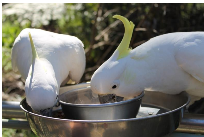
休暇中に出かけた山の中に、鳥に餌をやるところがありました