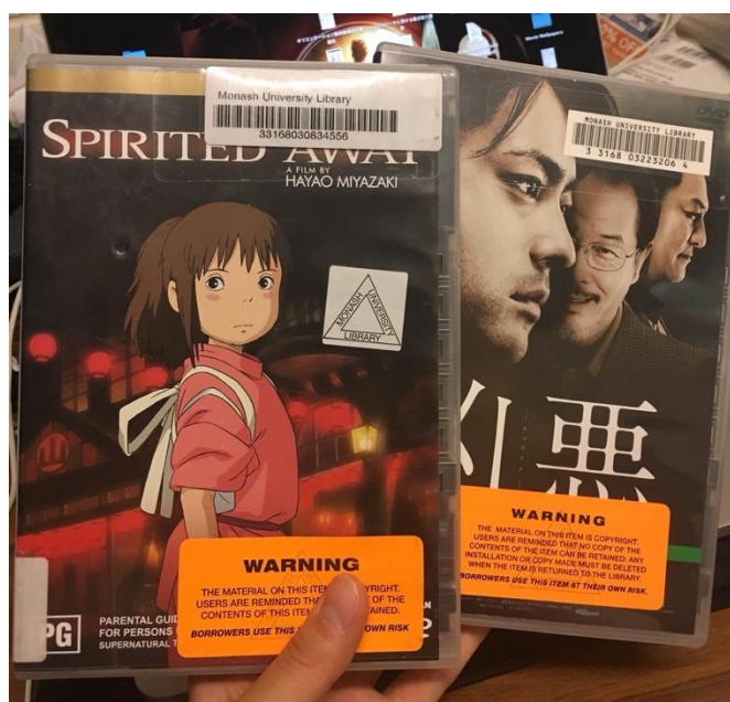
右のDVDは日本製だったので問題なくDVDプレイヤーに読み込まれましたが、