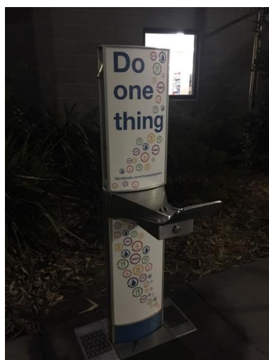
至る所にある水道ポイント

今月の最終週からモナシュ大学の方でも後期の授業が始まりました。今期は前期の反省を生かし、早くからペースを掴めるように頑張っています。その甲斐もあってか、今のところは前期の最初ほど授業を苦痛に感じていません。ただ、今期は授業も一つレベルアップしたものを選んだので、今後の課題が厳しいのだと思います。早め早めに普段の勉強をこなして、前倒して課題の作業に入ることが理想です。