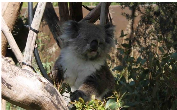
遠足で行った Healesville Sanctuary で撮影したコアラ

ここまで駆け足で留学の準備や授業について書いてきましたが、書き忘れたことがあった場合には次の月以降の報告書に書いていこうと思います。まだ分からないことだらけですが、少しずつ慣れていくことができると考えています。