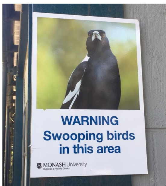
日本では見たことない白黒のカラスみたいな鳥がそこら中に沢山います