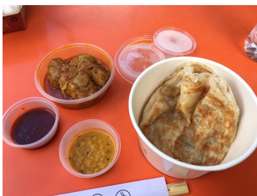
大学構内には色々な国の料理の店がある 写真はマレーシア料理のファストフード店で買ったロティ

また体調を崩したことに加え、寮の騒音も大きなストレスの一つです。もうこれに関しては誰に相談しても無駄だということが分かりました。エッセイの締め切りに追われていてかなり疲れが溜まっているにも関わらず、真下の部屋に住人が夜遅くに騒ぎ出して眠れなかったり、廊下で他の住人が大声でおしゃべりをしていたりして、その騒音のせいで眠いのにも眠れず、気が狂いそうでした。職員に相談しても「うるさくなったら直接こちらに個人的に電話をしてくれ」と言いましたが、電話をしても直ちに出て対応してくれず、それから決定的な対策を取ってくれません。アシスタントの人は協力的で、私と同じように学生のため期末で忙しいにも関わらず、相談した時にはうるさくしている住人のところに行って注意をしに行ってくれましたが、その当該の住人が、注意をされた直後は静かになっても、しばらくすればまたうるさくなるので、あまり効果が無いようです。今はテスト以外の課題が全て終わり、こちらにも心の余裕が出てきましたが、次のセメスターも同じようにストレスを感じた学校生活を送りたくはないので、別の寮に移ることを考えています。希望通りに行くことは保証できないと言われましたが、一応寮の移転希望届は出し、今のところは結果待ちです。