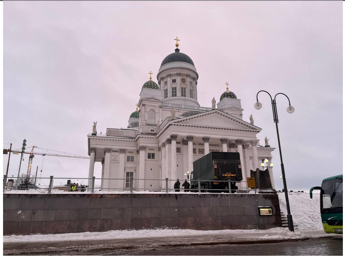
タンペレにある大聖堂です。