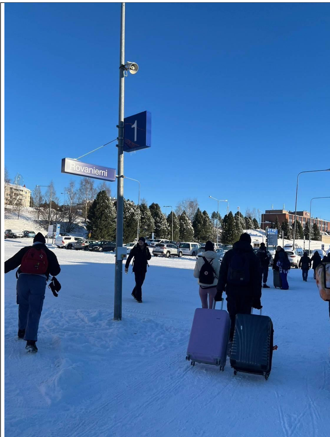
フィンランドの観光地 ロバニエミです。 これも2月ですが、雪がふかふかで歩くのが楽しかったです。