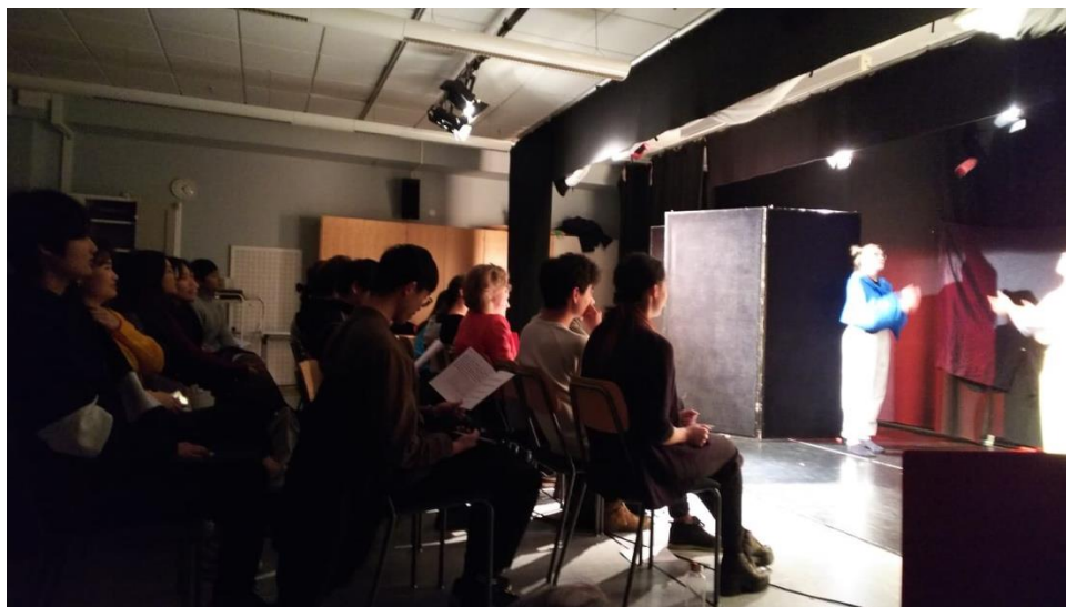
最終プレゼンテーションの様子。照明や音響、衣装等も本格的です。

結論から言うと、この授業が一番印象に残っています。各授業ごとに体を使ったエクササイズやアクティビティをしていき、その中でクラスメートとどんどん仲良くなっていき友達をたくさん作ることができました。また、それ以外にも授業内で行うさまざまなテーマのディスカッションを通して各国のカルチャーを学べたことも良かったです。そして、なんとと言っても、グループごとに分かれて約2週間で20分ほどの劇を作り実際にオーディエンスの前で発表する最終プレゼンテーションでは、普通の授業では得ることができないような達成感と満足感を得ることができました。以上のような活動を通してコミュニケーション、他文化、そして演劇について体験的に学ぶことができたこの授業はとても思い出に残っています。最終レポートはコミュニケーションやカルチャーに関するレポートに加え最終プレゼンテーションの振り返りも含まれており、自分は無事期限内に提出できる見込みです。