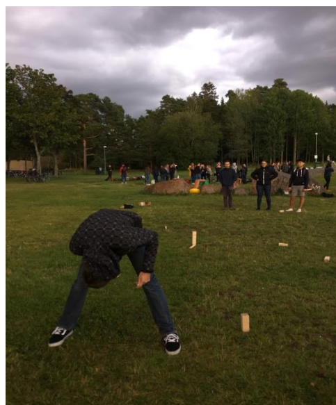
スウェーデン伝統のゲームの体験イベント