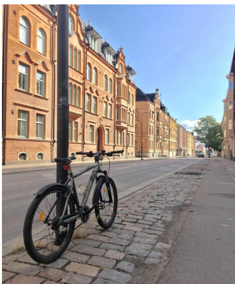
中古の自転車とダウンタウン近くの街並み

また、その約1週間以上の猶予の間にリンショーピン大学の学生団体が開くさまざまな留学生交流イベントにできるだけ多く参加したため、一緒に夕飯を作って食べたりお買い物に行ったりフェスティバルに参加する留学生の友達もできました。8月半ばごろからは授業が始まり急激に忙しくなりましたが、それでもそういった友達との交流をより深めていき、勉学と両立していきたいです。ちなみに、授業が始まりはしたものの、火災報知器が作動して急遽学生全員帰宅させられたり、大学に脅迫状のようなものが届き（結局はイタズラでしたが）急遽キャンパスが封鎖されたり、先生がディスカッションのために予約していた部屋がダブルブッキングで急遽使えなくなったりと、ハプニングがよく起こったりもしています。