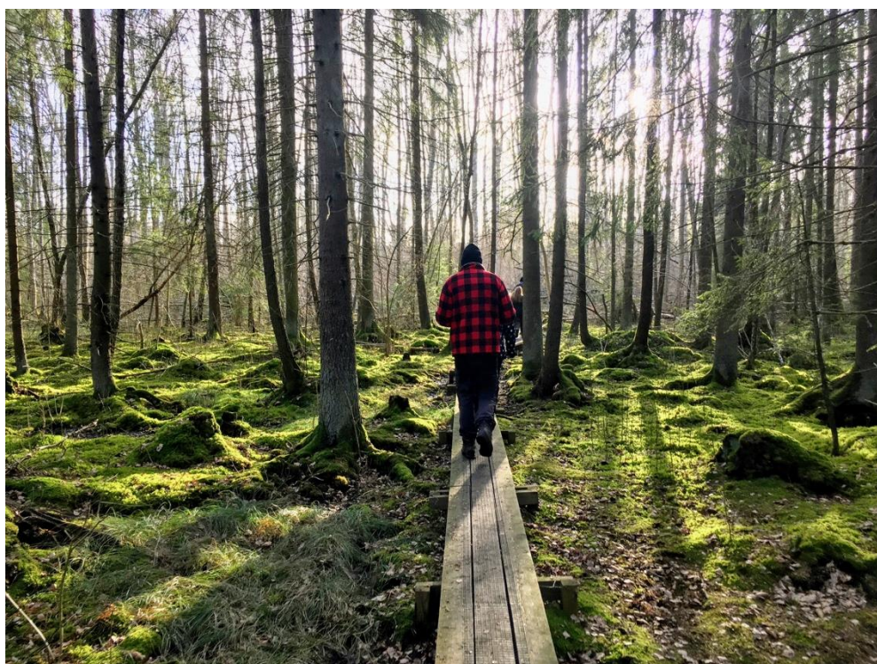
(森の中をハイキング)

この授業は、スウェーデンで伝統的に行われている「野外教育」について実際に自分達も体験して学習するという授業でした。具体的には、大学近くの森でBBQをしながら歌やダンスを踊ったり、スケートをしながら体育の授業のように楽しく体を動かしたりなど、授業回数は少なかったですが全て実際に野外で行う授業だったので楽しかったです。スウェーデンの広く雄大で綺麗な森を存分に体験する事ができるアクティビティがとても楽しかったです。しかし、新型コロナウイルスの影響で受講していた生徒の多くが途中で帰国してしまい、また、野外での活動もできなくなってしまったため授業は全てレポート形式になってしまいました。残念な事でしたが、留学生の皆と自然の中で体験的な学習ができたことは貴重な経験でした。