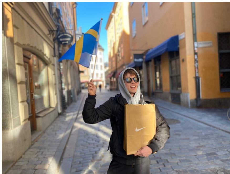
(ストックホルムからさようなら～)

私が留学することを決めてから帰国するまでの長い間、私を支えてくださった留学生支援課や英語教育選修の先生方、家族、友人の皆さん、本当にありがとうございました。皆様のおかげで約 8 ヶ月間の私の留学生活はとても有意義で充実したものとなりました。そして、この報告書が今後多くの留学を考えている多くの学生さんのお役に立てればと思います。