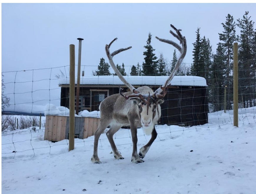
(サーミ民族と暮らすトナカイ)

リンショーピンの冬は毎年寒くて雪がよく降るらしいのですが、今年は例外で気温が暖かくあまり雪が降りませんでした。冬のスウェーデンを体験することは留学前から楽しみにしていただけに少し残念でした。けれど、1月の初め頃にスウェーデンの北に位置するラップランドというとても寒い地域に行きたくさん雪を見たり犬ぞり体験やトナカイと暮らすサーミ民族との交流をする事ができました。一番の目当てのオーロラは天候が悪く見れませんでした…。