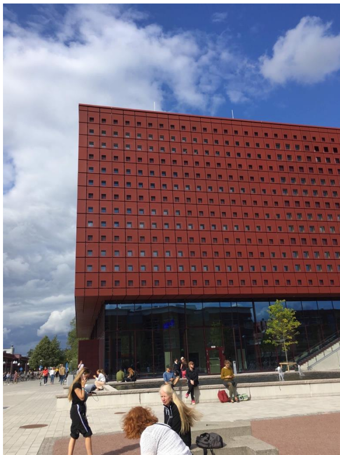
いつもお世話になっている図書館。外観のデザインが素敵です。

この授業はパートタイム、要するに短期間のみので授業だったので1ヶ月ほどで授業自体は終了し、最後にスウェーデン含むヨーロッパの教育の歴史に関するいくつかの問いに授業で学んだことを活かして回答するという最終レポートが課されました。毎日図書館に籠りメモや文献を参考に一生懸命レポートを作成し無事提出しましたが最終成績は悪かったです…。一応不可ではなく合格ではあるので良かったです。少し悔しかったです。