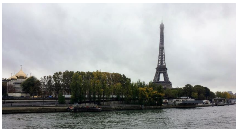
休みを利用して行ったパリ旅行。ヨーロッパ内の旅行は場合によっては飛行機往復チケットが