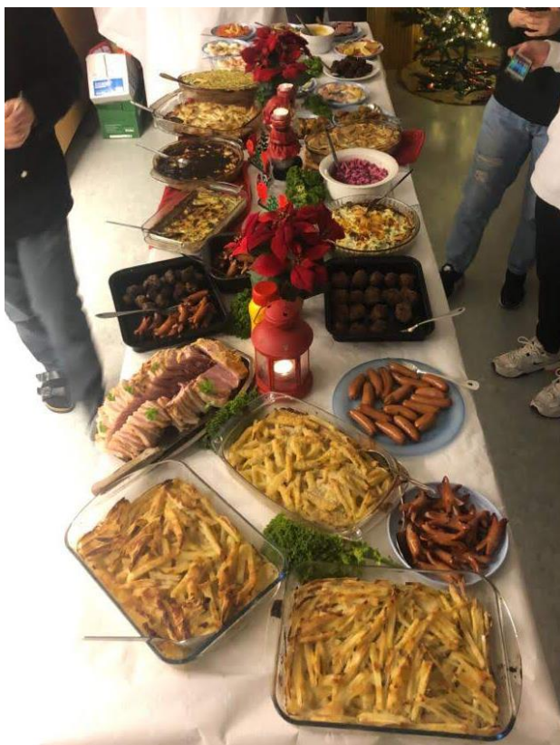
スウェーデン伝統のクリスマスディナー。

現在は冬休みで、約2週間後には新しいセメスターが始まり、また新たな留学生との出会いもあると思います。次セメスターは前セメスターに比べて専門科目である教育に関する授業が倍以上に増えるため、これまでとは気持ちを改めて再び学生生活に戻り、また、帰国後のこともしっかり考えて勉学に励みたいです。