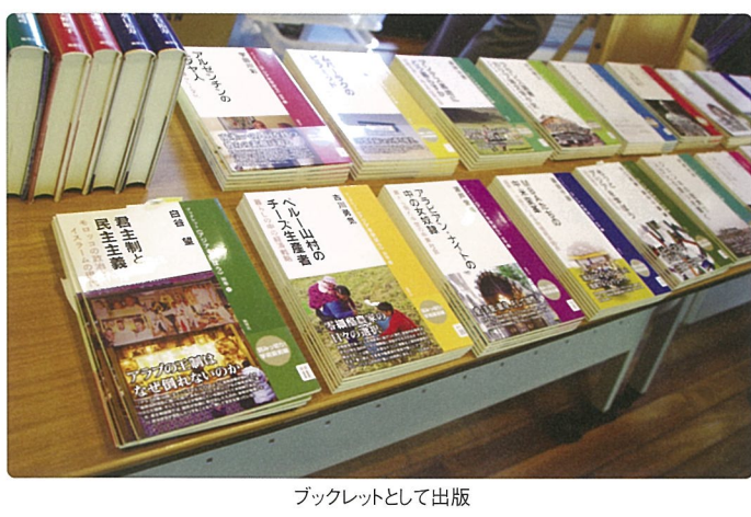
ブックレットとして出版