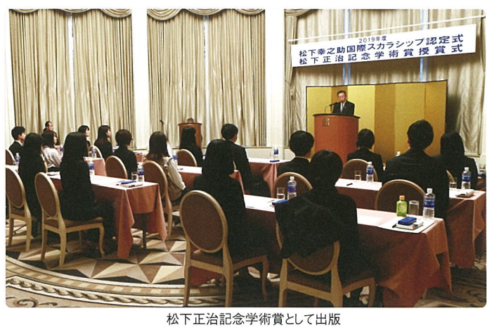
松下正治記念学術賞として出版