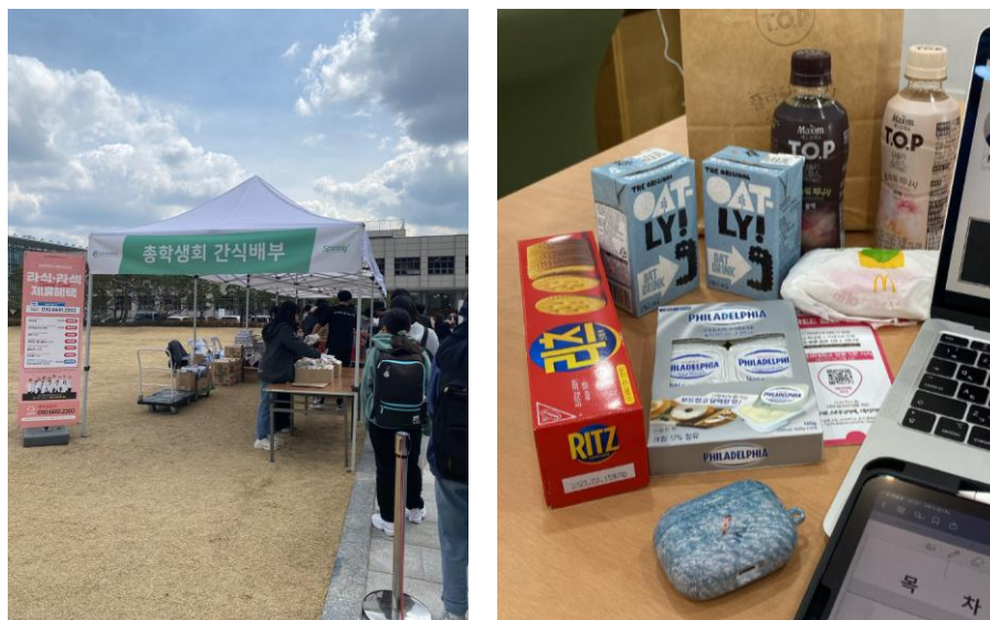
(中間応援キットとその中身)

り、中間前の3週間サークルがなくなることが高校時代に戻ったようで驚きでした。千葉大に比べて課題が多いようには特に感じませんが、現地学生に引っ張られて私も勉強を頑張っています。