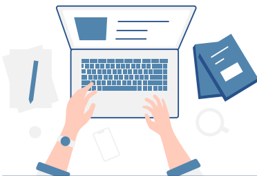
資料のダウンロード・ 情報収集

日本国内・海外どこからでも参加でき、ドイツの大学・研究機関が日本の学生やポスドクのために集結する貴重な機会です（参加無料・要参加登録）。ご参加お待ちしております！