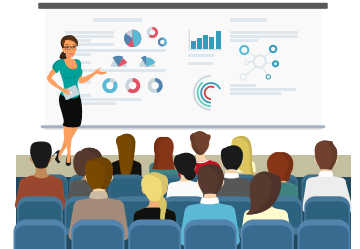
オンラインセミナー への参加