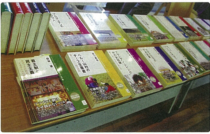
ブックレットとして出版