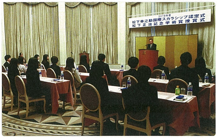
松下正治記念学術賞として出版